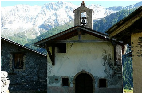
Office de tourisme de Peisey Vallandry

Vous remarquerez la belle serrure de la vieille porte, le bénitier dans la fenêtre, le petit clocher avec sa flèche de tuf.