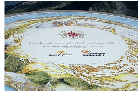
Ancienne table d'orientation de la Grive

Il est possible bien sûr de faire cette boucle en partant du col d'Entreporte, pour ceux qui arrivent courageusement de la vallée à pied. Cependant le fait de prendre de l'altitude avec le télécabine met ce sommet panoramique à portée de ceux qui n'auraient pas pu marcher autant !