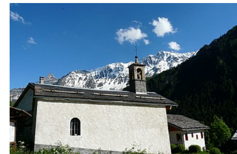
Office de tourisme de Peisey Vallandry

Contact : Téléphone : 04 79 07 94 28 Email : info@peisey-vallandry.com Site web : http://www.peisey-vallandry.com