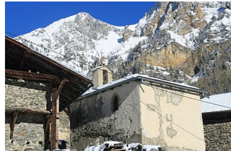
MNPC OT Peisey-Vallandry

Contact : Téléphone : 04 79 07 94 28 Email : info@peisey-vallandry.com Site web : http://www.peisey-vallandry.com